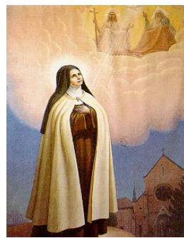
Beata Isabel de la Trinidad